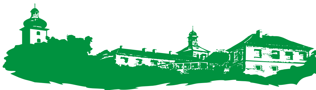
SOŠ a SOU Horky nad Jizerou