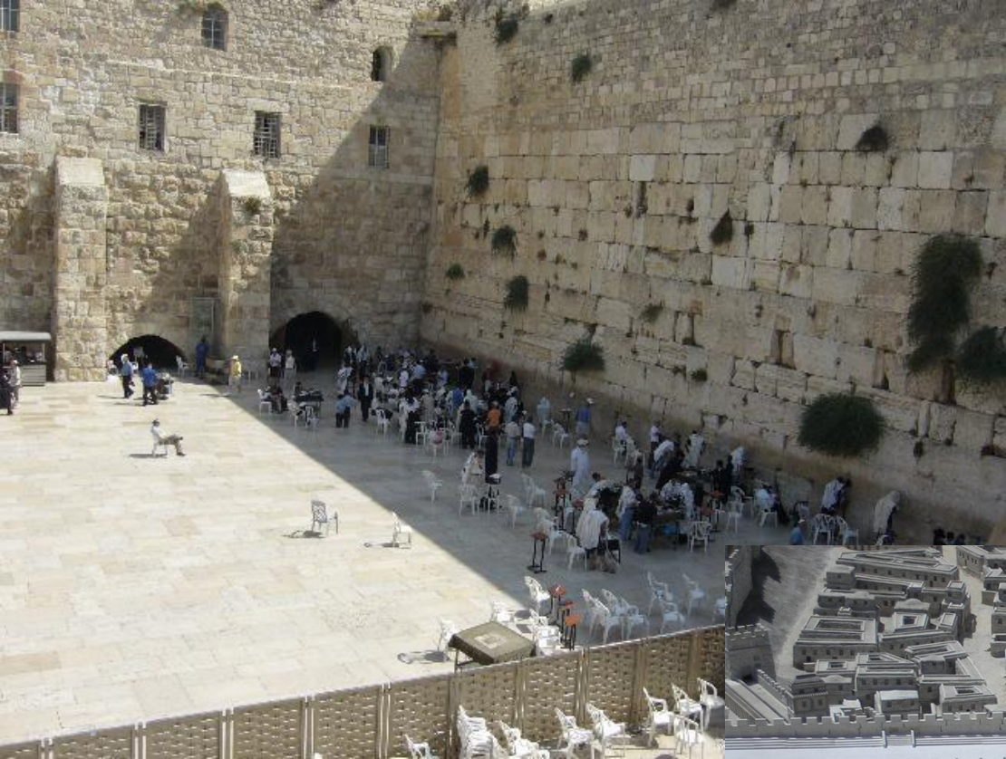
Zed' nářků v Jeruzalémě