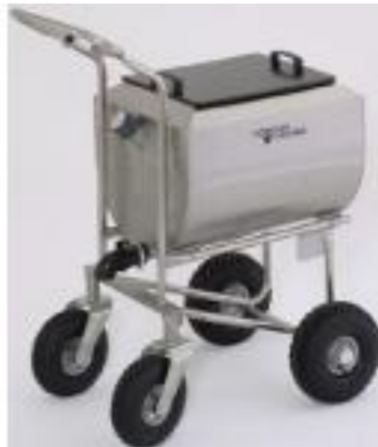
Obr.7 Vozík na mléko bez pojezdu, 100l, nerez