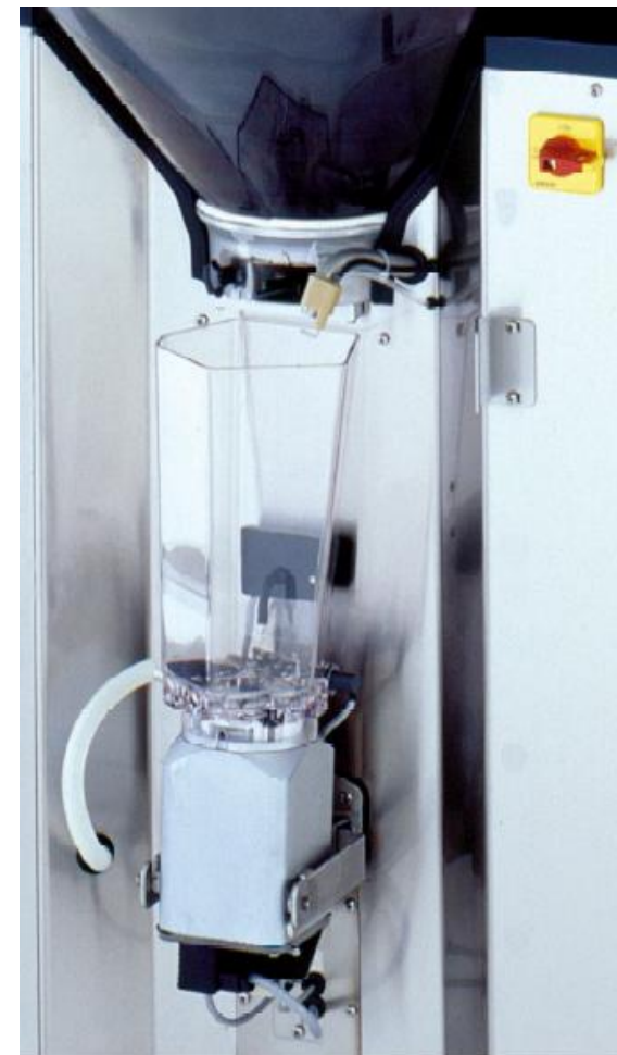
Obr.8 Napájecí automaty