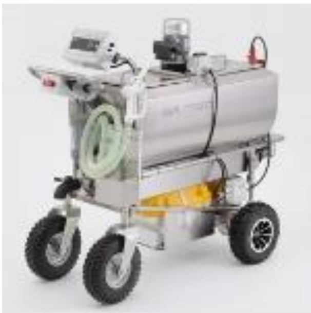
Obr.6 Vozík na mléko pro telata s pojezdem