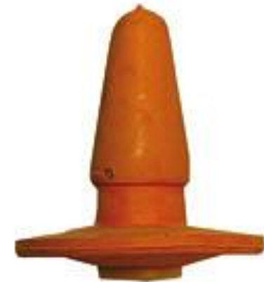
Obr.3 Dudlík plouvoucí

Dodržování hygieny – po každém napájení mytí nádob teplou vodou, dodržovat teplotu mléka