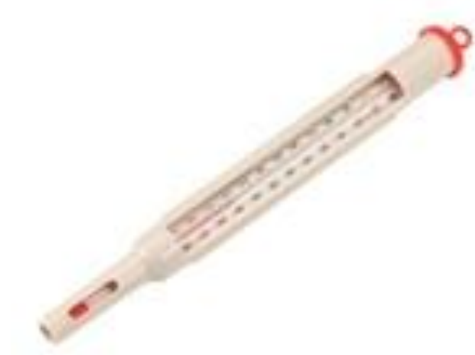
Obr.10 Teploměr na mléko