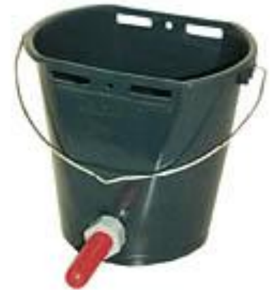
Obr.2 Napájecí kbelík

Dodržování hygieny – po každém napájení mytí nádob teplou vodou, dodržovat teplotu mléka