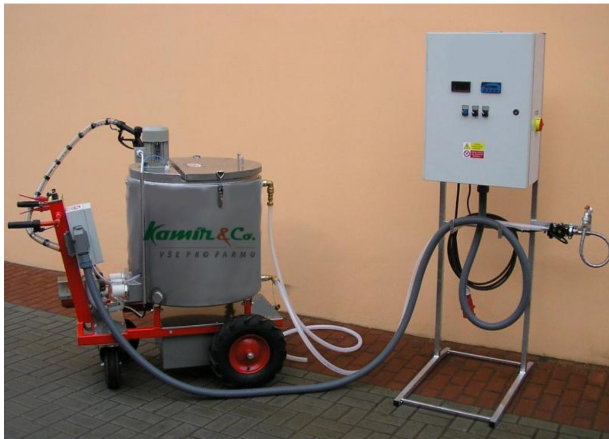
Vozík na mléko pro telata