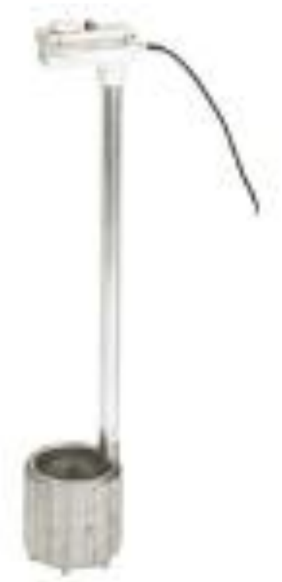
Obr.9 Ohřivač mléka,termostat