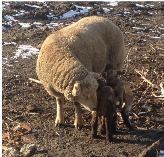
Obr.2 Staří jehňat 2 dny