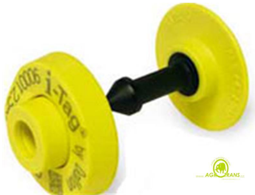
Obr. 6 elektronická identifikační známka