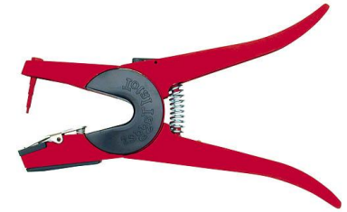
Obr.3 Ušní známky pro ovce malé