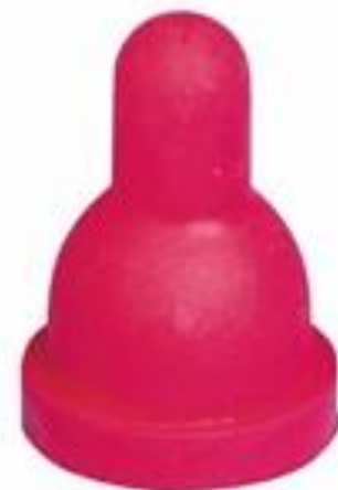
Obr.1 Napájecí pomůcky pro jehňata