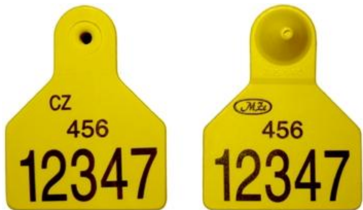
Obr.5 Ušní známky