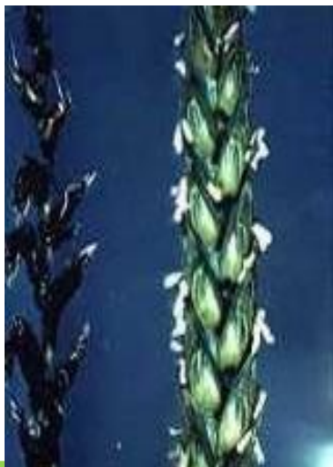
Prašná sněť pšeničná