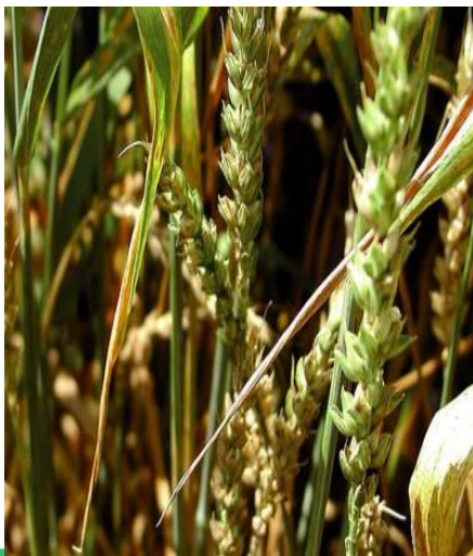
Mazlavá sněť pšeničná