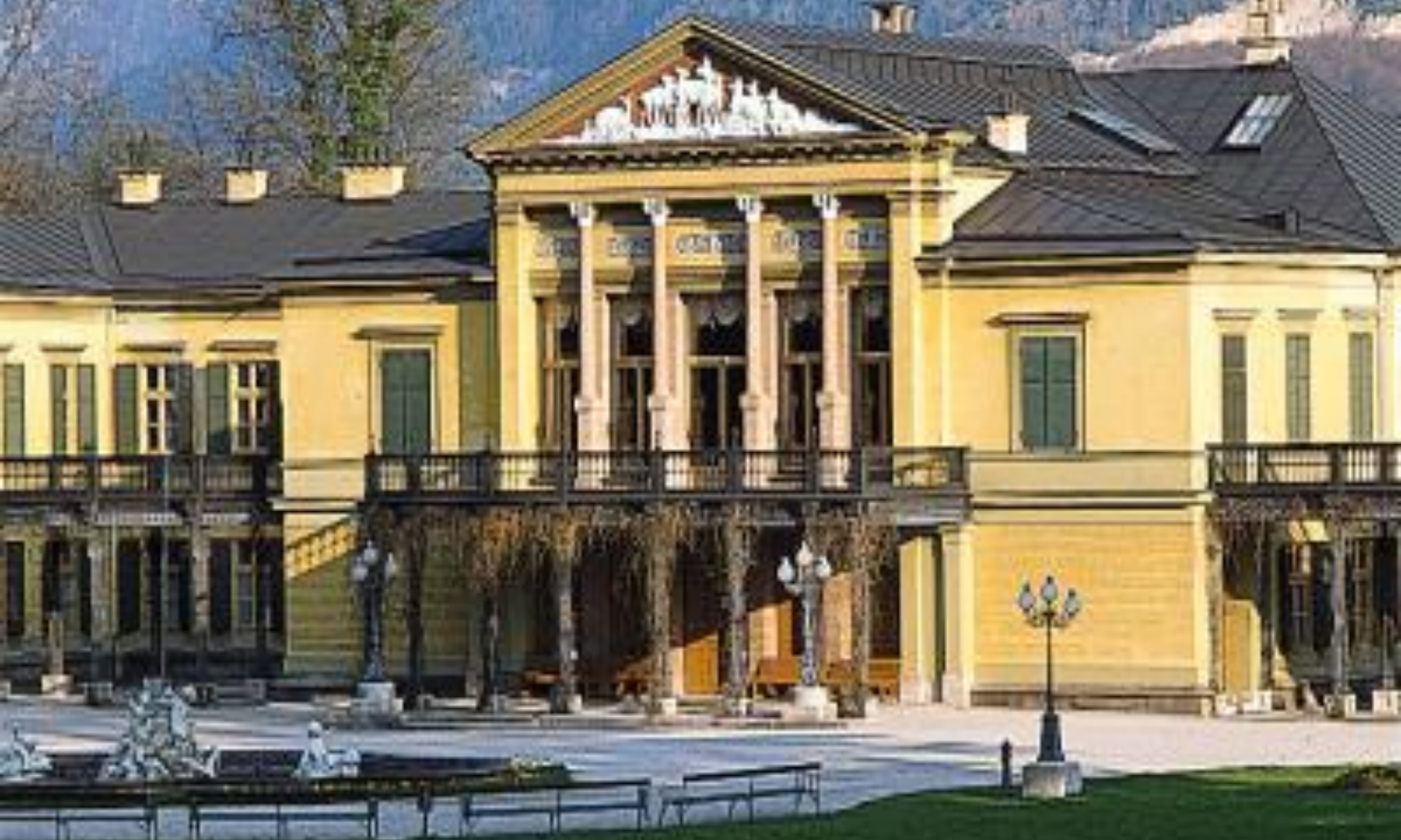
Císařská vila (Kaiservilla) (Bad Ischl, Solná komora)