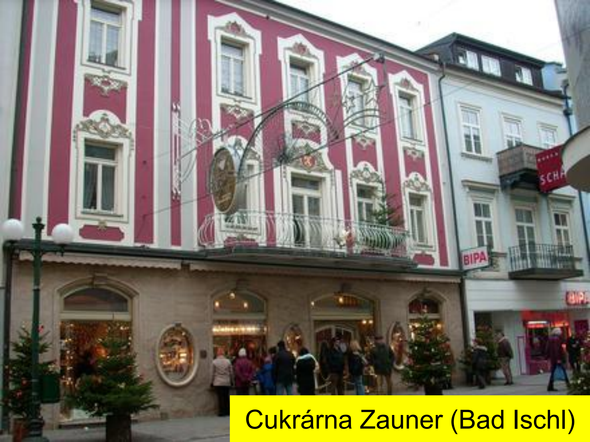
Cukrárna Zauner (Bad Ischl)