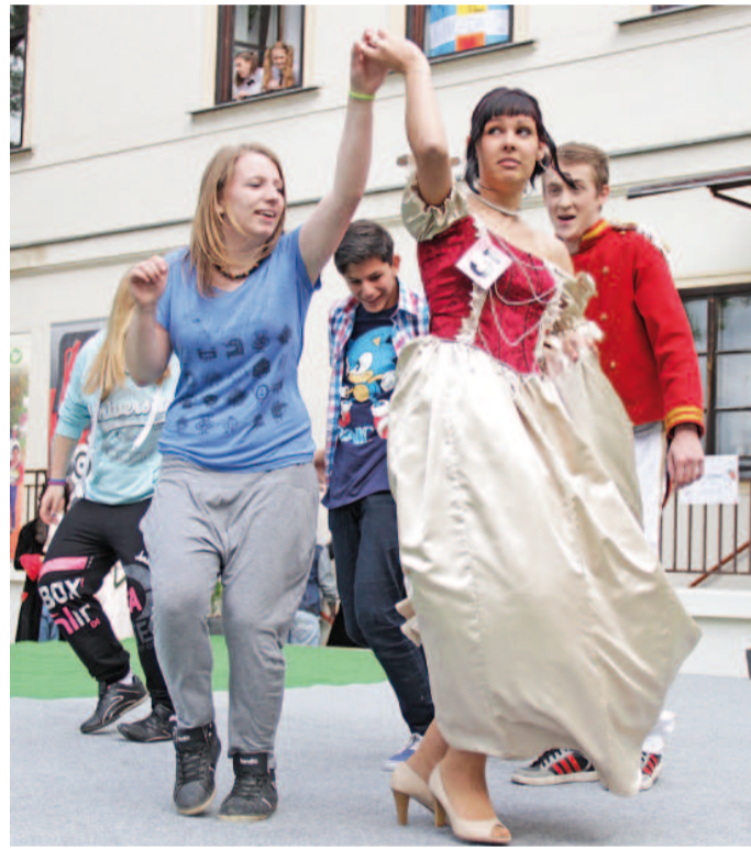
NA SVÁ vystoupení se děvčata a chlapci pilně připravovali.

Horky fest je podle ředitele školy každoročně plně v režii žáků. Připravují program, pilují volná vystoupení, chystají dobroty pro hosty a obsluhují. „Vedle toho ale běží i veškerá praxe. Večer po akci totiž patří vždy velkému rautu, na který žáci vše připravují,“ připomněl Vratislav Morava