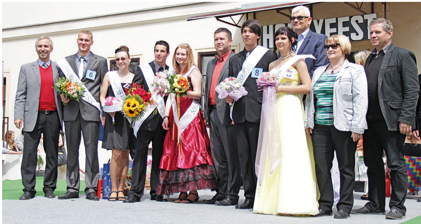
VYVRCHOLENÍM tradičního Horkyfestu na nádvoří horeckého zámku je pokaždé vyhlášení Miss a Gentlemana školy.