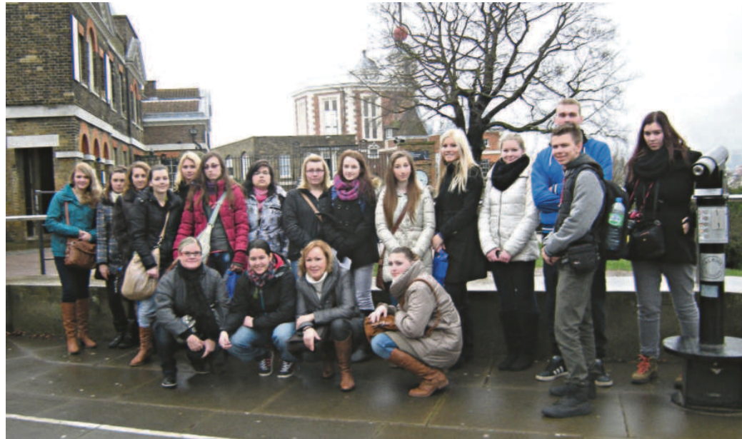
VÝLETNÍCI navštívili například Greenwich, Royal Observatory, Tower Bridge i Buckinghamský palác.

covské služby i s nalezením trasy a naplánováním dopravy londýnským metrem. Kromě nejvýznamnějších památek jako jsou Greenwich, Royal Observatory, Tower Bridge, Buckinghamský pa-