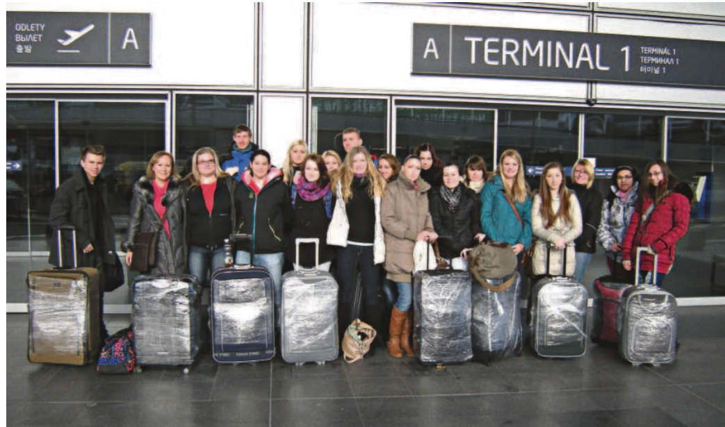
STUDENTI z horecké školy se vypravili na týden do slunného Londýna.

Předminulý týden byl nádherný. Strávili jsme ho totiž ve slunečném Londýně. Někteří z nás letěli poprvé letadlem.