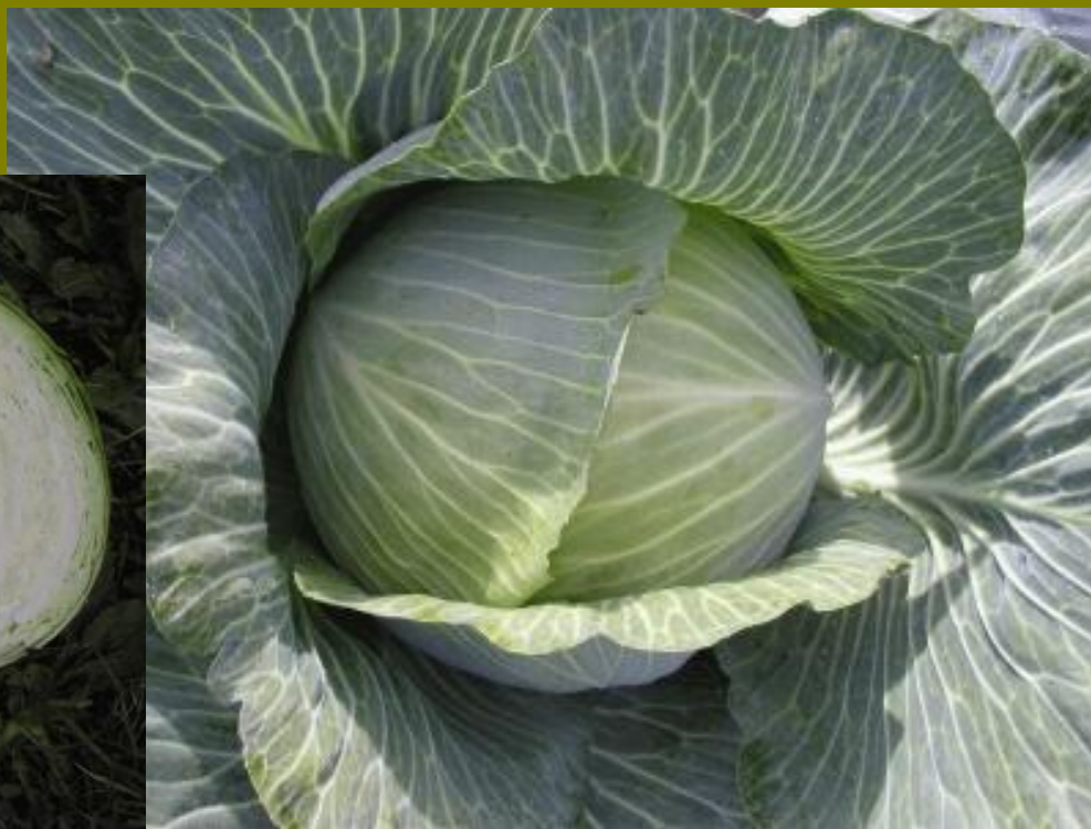
Hybridní odrůdy hmotnost hlávky až 2,5kg