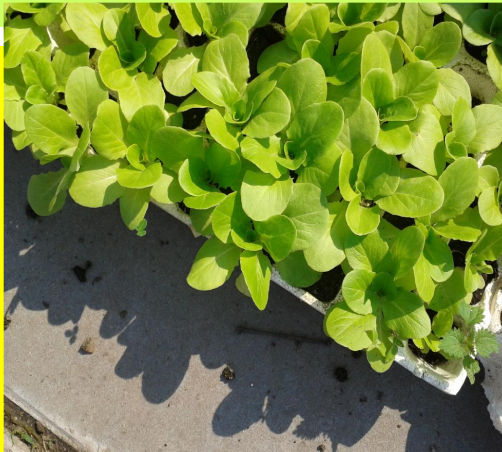
Rostliny salátu v sadbovači