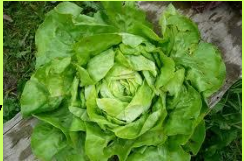
Odrůda salátu Amur