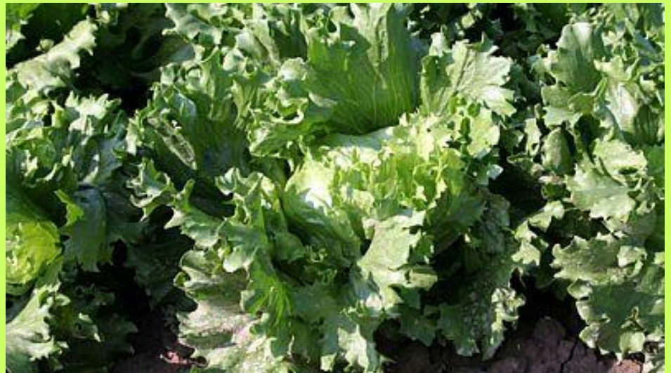
Ledový salát odrůda Traper