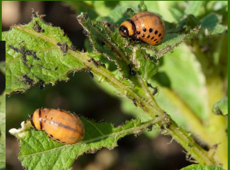
Obr.2 Larvy mandelinky bramborové