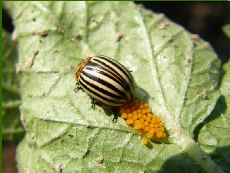
Obr.1 Mandelinka bramborová při kladení vajíček

Mandelinka bramborová Nejzávažnější škůdce brambor