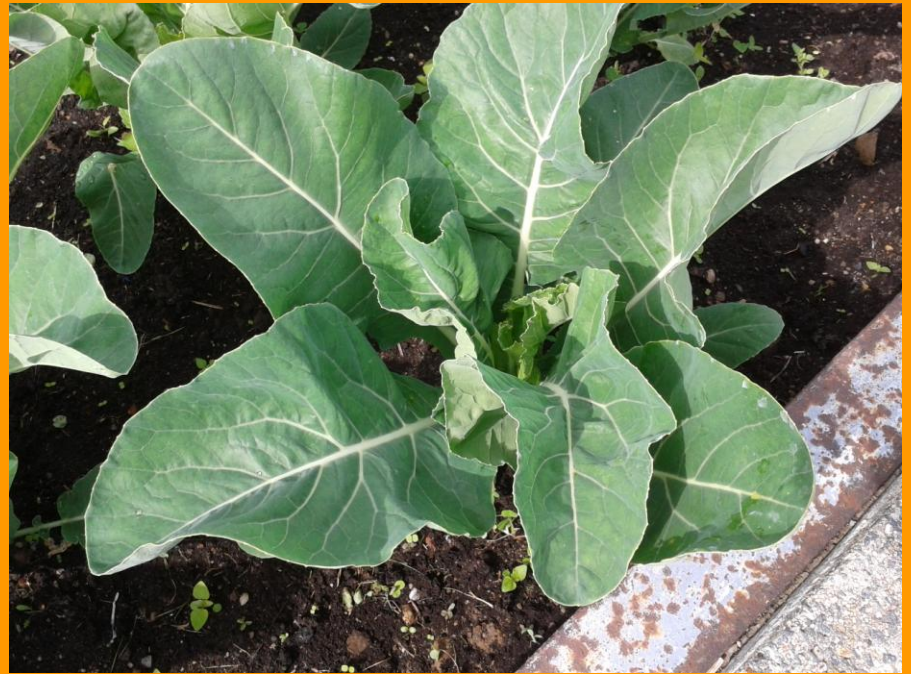
Rostlina květáku v pařeništi - odrůda Bora