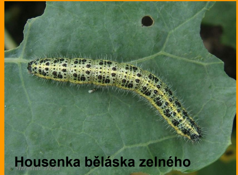
Housenka běláška zelného