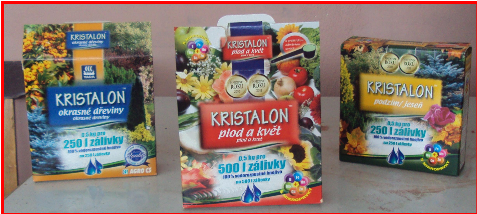
Kristalon – hnojivo práškové