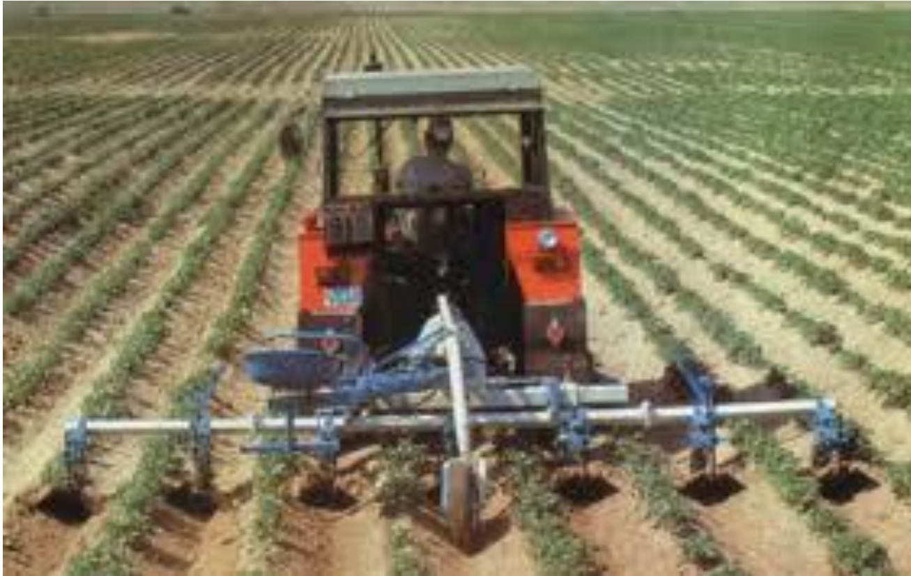
Pracovní operace na velkém pozemku – Hrobkovač v porostu brambor