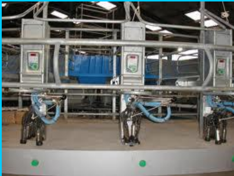
Rybinová dojírna fulvud