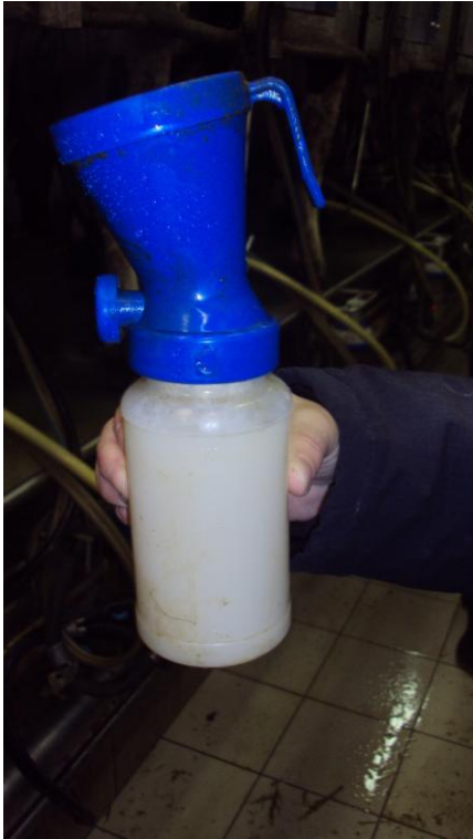
Čistící pěnová dezinfekce struků před dojením