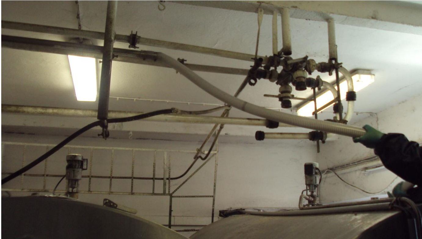
Umístění mléčné hadice do chladicí nádrže