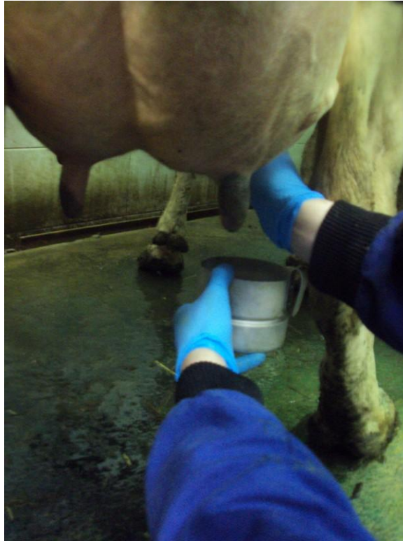
Odstřik mléka z každého struku