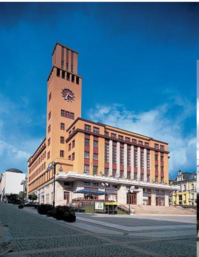
Kostel Nejsvětějšího Srdce Ježíšova ze 30. let