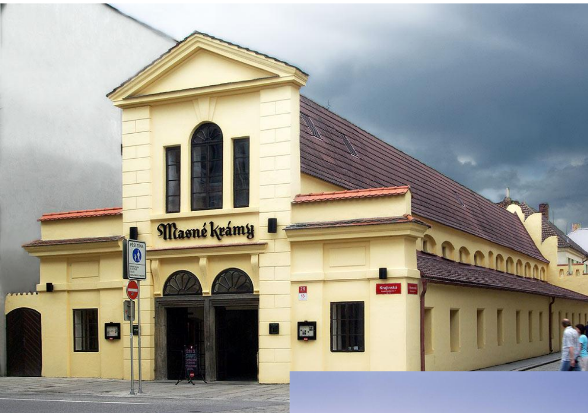
Restaurace Masné krámy