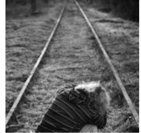
Hroch Tomík s Maruškou