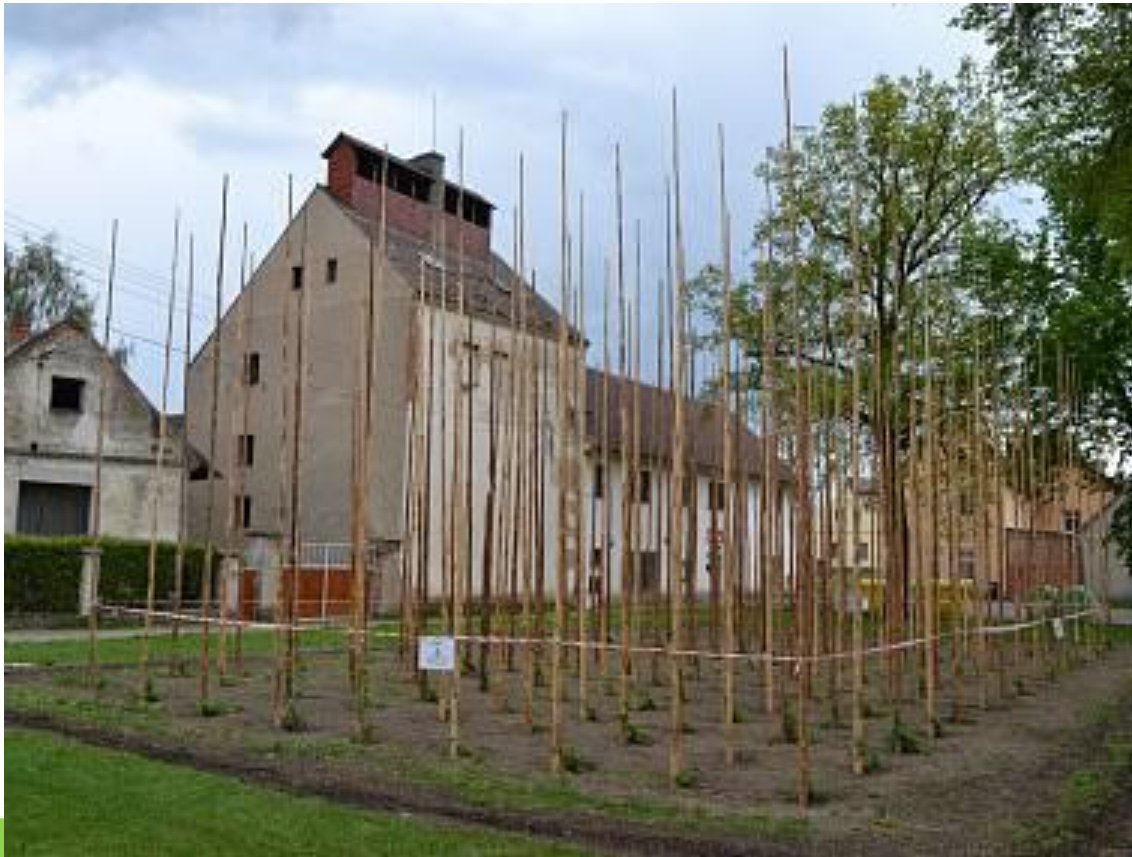
Tyčová chmelnice v Kolečovicích

Žatecký poloraný červeňák – nejpěstovanější odrůda v ČR